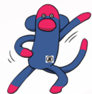
公式マスコットキャラクター おのくん