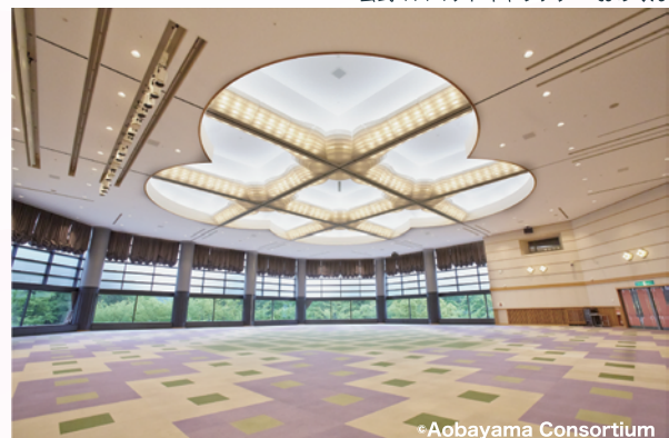
World Bosai EXPO会場